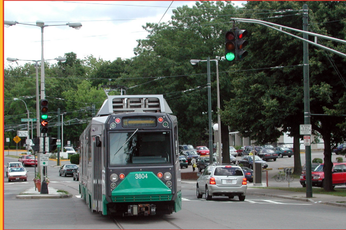
Guia de prioridade de sinais de trânsito

A MPO da Região de Boston prevê um sistema de transporte moderno e bem mantido que suporta uma região sustentável, saudável, habitável e economicamente vibrante. Para alcançar essa visão, o sistema de transporte deve ser seguro e resiliente; incorporar tecnologias emergentes; e fornecer acesso equitativo, excelente mobilidade e variadas opções de transporte.