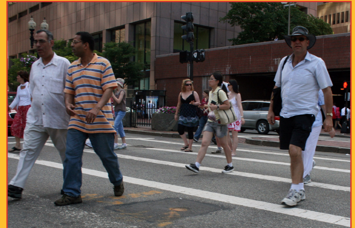
Banco de dados interativo da avaliação do relatório de pedestres

Os estudos anteriores estão disponíveis em nosso Arquivo de Publicações .