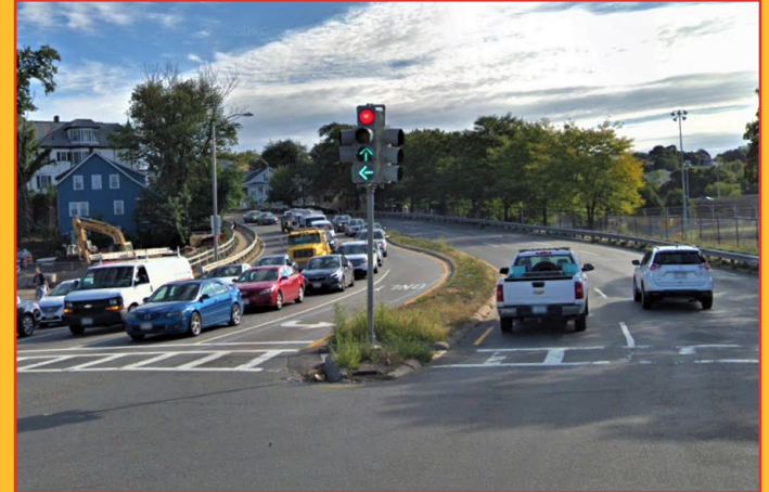
Estudo de corredor prioritário da rota 16, Chelsea e Everett, Massachusetts