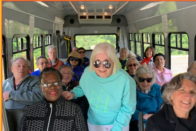
Guia de operação de um programa de transporte comunitário de sucesso